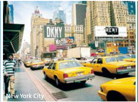
New York City