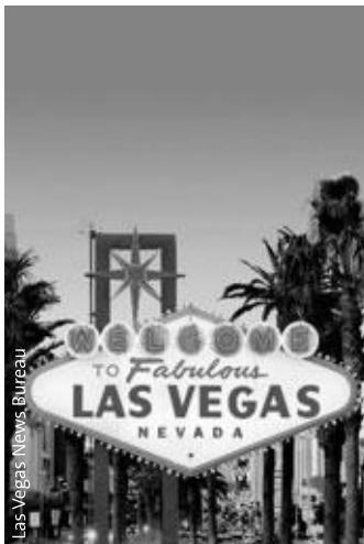
Las Vegas News Bureau