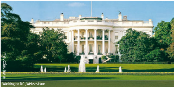
Washington D.C., Weisses Haus